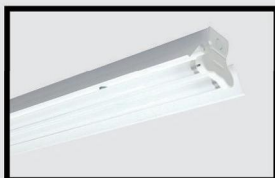
LTH: chóa sơn tĩnh điện