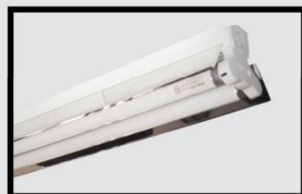
LBB; LDH: chóa phản quang